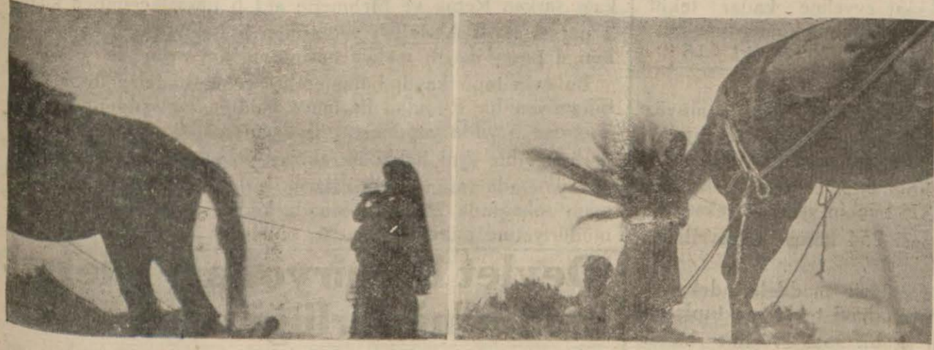
Solda çocuklu bir kadın, sağda iki çocuk harman döğüyor