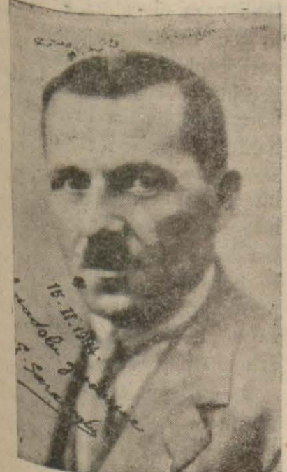
Bay Şükrü Saracoğlu Adliye Vekili B. Şükrü Sara- oğlu, Ödemiş'e Gölcükteki köş- künde istirahat etmek üzere bugün denizyolu ile İstanbuldan şehrimize gelecek ve akşam üzerine doğru Ödemiş'e hareket edecektir. Vapur- da istikbal edilecektir.

yetçi gelmiştir. Bunlar, muhtelif yerlere yerleştirilmiştir.