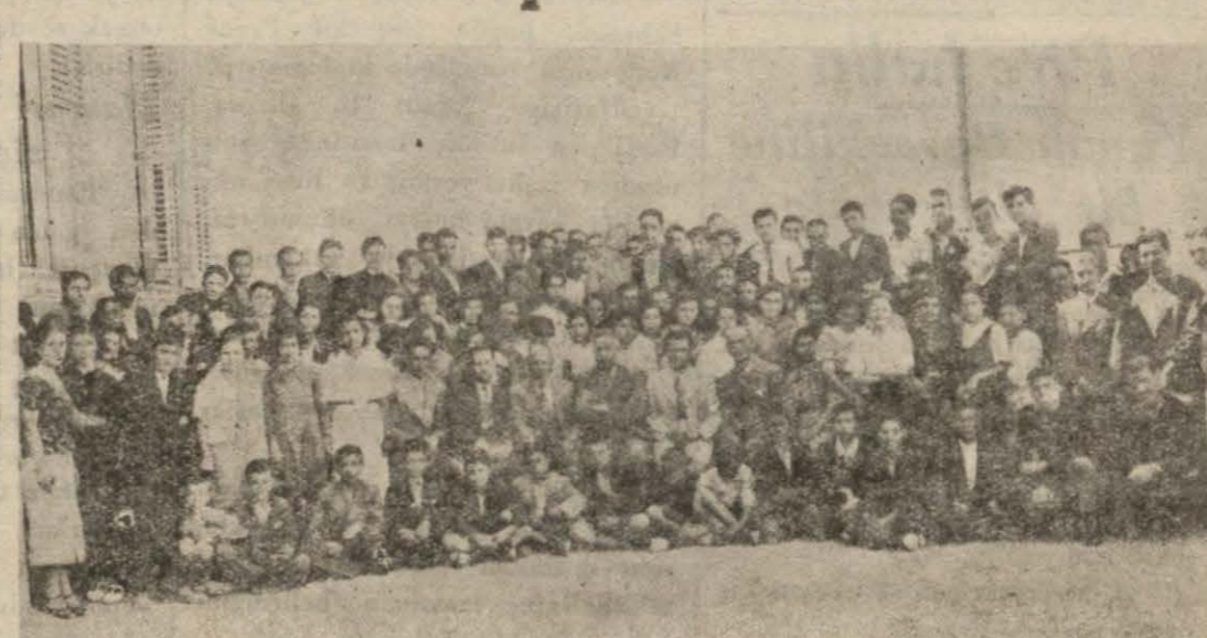
Kursa devam eden talebeden bir kısmı ve muallimleri