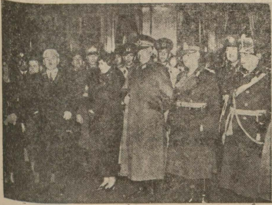
Mareşal Fevzi Çakmağın Bükreşte alınmış resmi

Balkan devletleri erkânı harbiye reisleri İstanbul- da umumî bir toplantı yapacaklardır