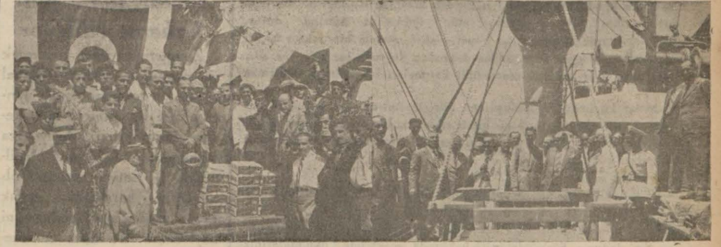
Üzümler şatta ve vapurun ambarına girerken

Tokyo, 24 (Radyo) — Ja- ponya, bu sene bütçesin- deki açığı kapatmak üzere yeni bir istikraz yapmak ta- savvurundadır.