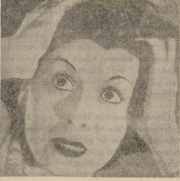
Hâdisenin zavallı kurbanı

Zabita hemen hâdiseye el atmış, eczacı kalfası nişanlıyı