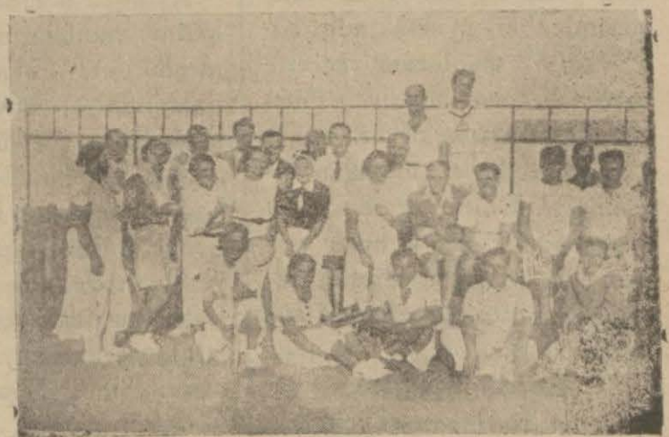
Tenis müsabakalarına iştirak edenler