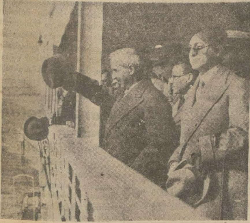
Başvekilimiz bir golculukta

General İnönü, derhal fuarı ziyaret edecekler ve Nazilliye kadar giderek kombinayı göreceklerdir