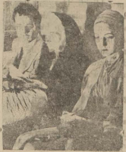
Filimden bir sahne

eğer siyasi fikir ve nazariyelerden tecrid edilirse, fena bir film değildir. Başlıca roller ve şahsiyetler bunlardır: