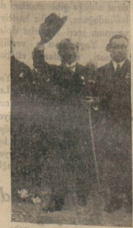
Başbakanımız general İsmet İnönü

Girid'li, yine kendi kitabını, yine kendi gazetesini, gâni Türk olan eseri okur. Halbuki bir Yahudi, İspanyolca, Fransızca gazete ve kitabı Tevrat gibi elinden düşürmez. Değil Türk dilini konuşmak, Türk neşriyatını, Türk kitap ve gazetesini bile okumak istemez. Bu arkadaş, Türk Girid'li ile Türk'leşmekten bile çekinen Yahudi'yi nasıl bir tutuyor, anlıyamıyoruz. SAPAN