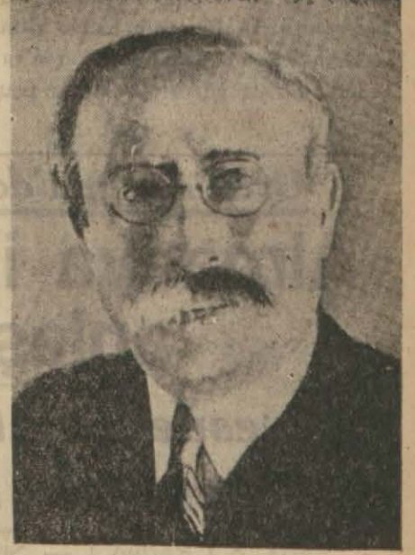
M. Leon Blum

edilmemiştir. Ve Cenevre'ye dönmek için Cenevre'nin artık birşey yapamamasını şart koyuyor. O halde zecri tedbirleri kaldırmak faydasız birşeydir.