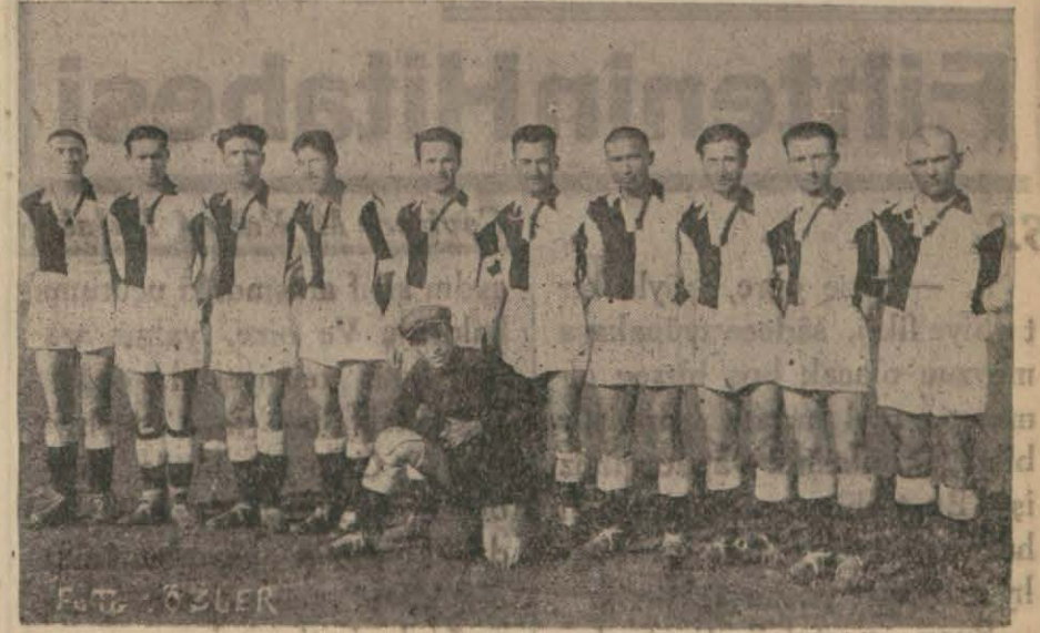
Uşak Turan İdman yurdu.

Uşak, (Hususî) — Afyon Kocatepe spor kulübü şehrimize geldi. Turan İdman yurdu ile karşılaştı. Misafirler alâka ile karşılandılar. İki memleket gençliği üç buçuk yıldır karşılaşmamışlardı. Hakem Gençler birliğinden muallim Şerif Çamlıbel'di. Uşak kuvvetli bir kadro ile çıkmıştı. Afyon da çok kuvvetli idi. Devre ortalarına doğru Turan santerforunun ayağı ile ve sıkı bir şutla devrenin ilk ve yegâne sayısını çıkardı.