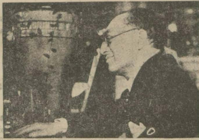
Tefik Rüştü Aras konferansta.

Doktor Tefik Rüştü Aras dün İtalyan müşahidi B. Bovaskop'yu kabul etmiş ve kendisine boğazlar mukavenemesi projesinin bir kopyasını vermiştir.