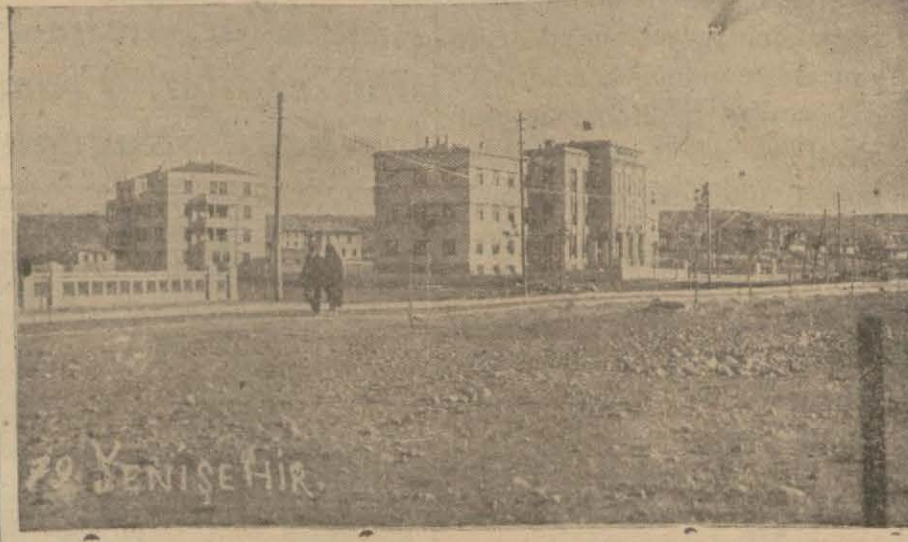
Ankara'dan bir görünüş..

Taymis, demiryollarımız, sıhhat ve nüfus işleri ile dost intihabımız hakkında ne diyor?