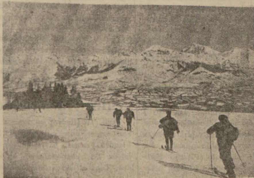
Karlı bir havada kayakçılar..

Hiçbir tren hattı işlemiyor. Kazalarda zarar çoktur. Uyanan bağlar zarar görmüştür