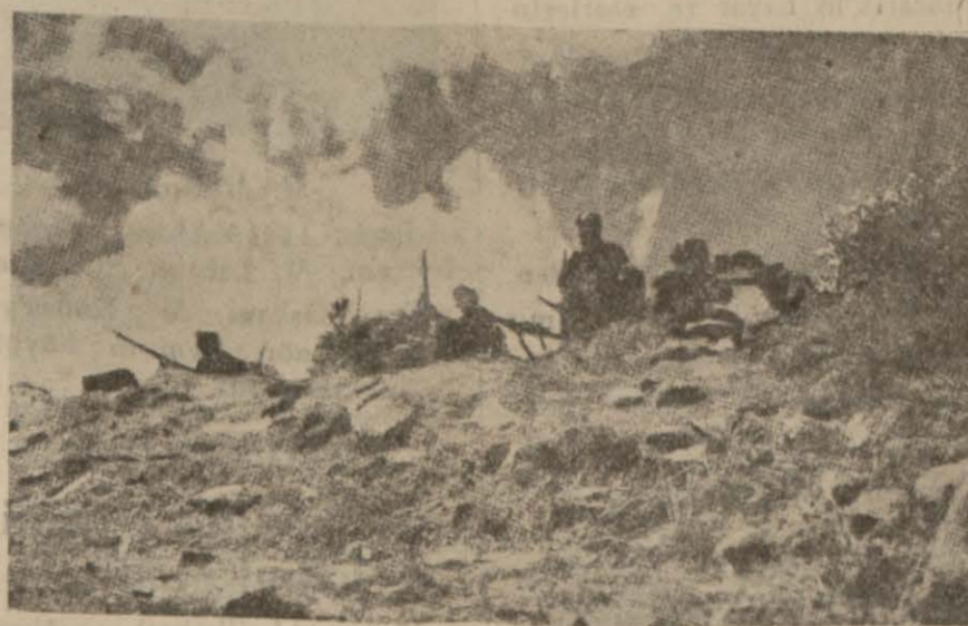
İtalyan hudud karakolları..

Londra 11 (A. A) — Şimal cephesinde, Habeş kuvvetleri yeniden Makalle etrafındaki mevzilere hücum etmişler, fakat anlaşıldığına göre bir muvaffakiyet elde edememişlerdir. Bu mevziler şimdî o kadar