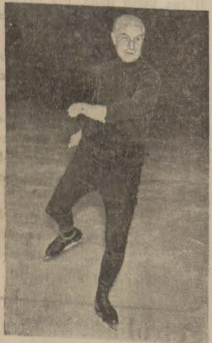
Sir Samuel Hoar

Londra, 11 (A.A) — Siyasal mehabilden bazıları son günlerde mevzuubahsolan kabine buhranının petrol ambargosu mes'alesinin hâdis olacağı fikrindedirler.