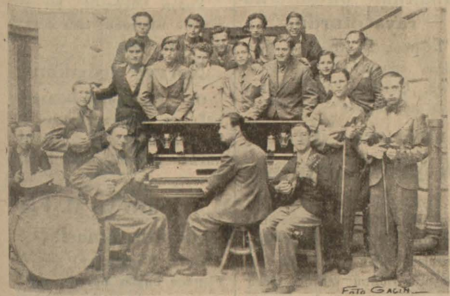
Müsamerede çok muvaffak olan sanatlar mektebi müzik takımı. (YAZISI İÇ SAHİFELERİMİZDE.)