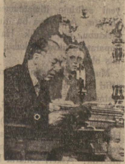
Tevfik Rüştü Aras

Dileğimizin tahakkuku ile iki asırdır harp zaviyesinden görülen boğazlar, bir huzur bağı ve vifak yolu olacaktır. Bugün gizli bir içtima yapılacaktır.