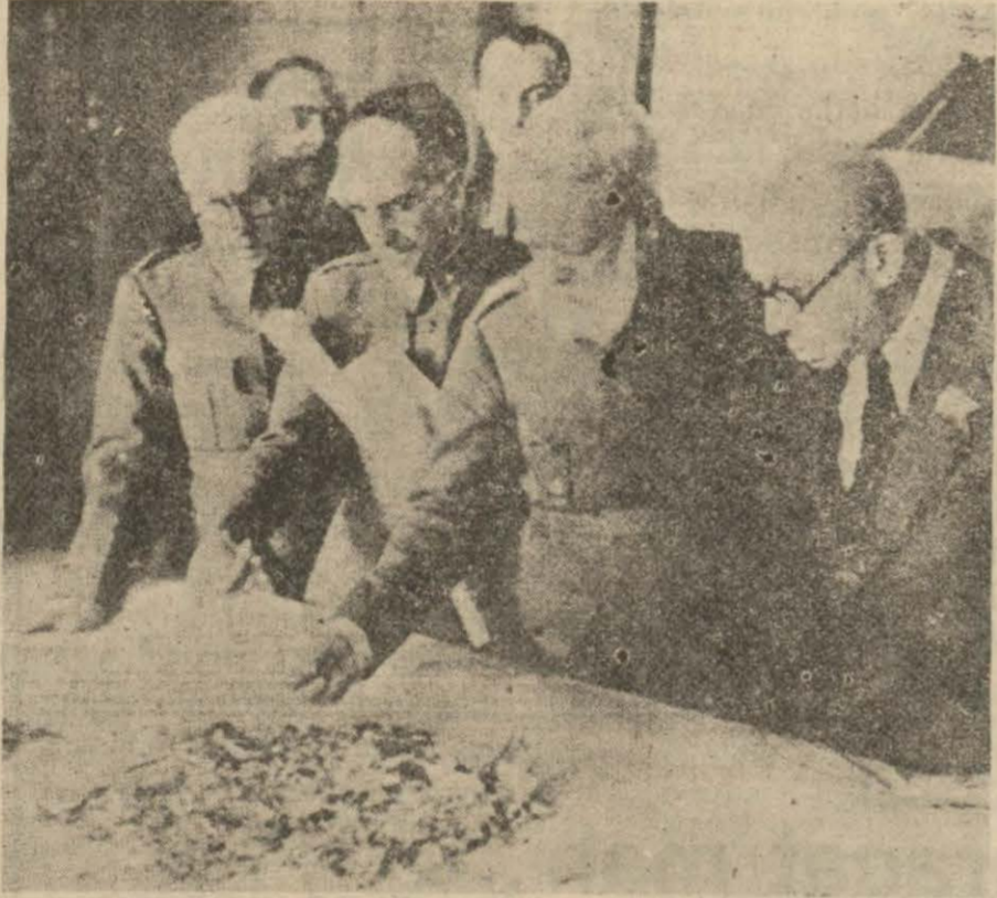
İspanya ihtilâlciler hükümeti reisi (Kabanela) toplanan müvevherat ianesine iştirak ederken

Sevil'den bildirildiğine göre askerî münakkidler, Marksistlerin, çok ağır zayıat verdiklerini bildiriyorlar. Nasyonalistler, bazı mühimmat elde