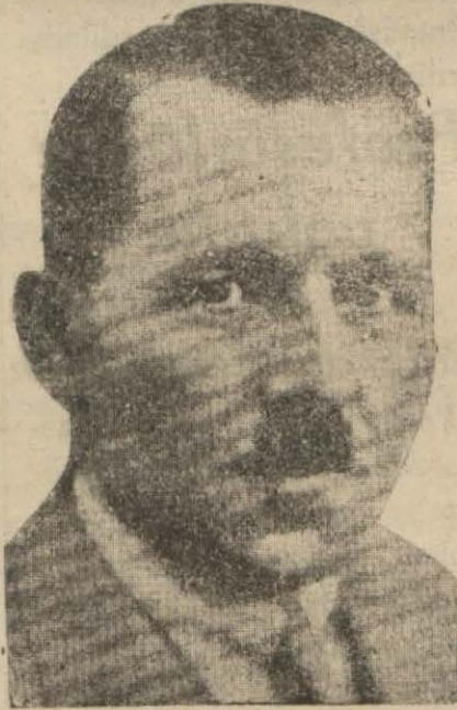
Adliye vekili Saracoğlu, Şükrü

Adliye Vekili beyanâtında; yalnız کافی delil yoksa tedariki için müddeiumumiye evrakın mahkemeye sevkini tehir selâhiyeti verildiğini söylemiştir.