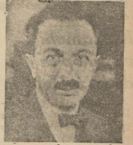
Kùltür Bakanımız Saffet Arıkan

İstanbul, 22 (Hususi muhabirimizden) — Kùltür Bakanı Saffet Arıkan beyanâtında; Üniversitedeki yabancı dil mektebinin ıslâh edileceğini, İstanbul ve Ankara hukuk fakülteleri ile mülkiyede tedrisatın, bu yıldan itibaren dört seneye çıkarılacağını söylemiştir. Kùltür ba-