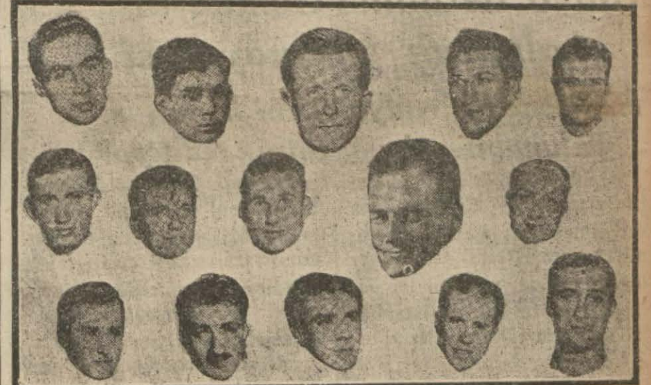
Rusya'ya giden sporcularımız

Akdeniz mes'eleli Habeşistan'ın fethi ve bu fethin hukukî ihtilâfları ve bilhassa İngiltere'nin Akdeniz siyaseti mes'eleleri halledilmeden evvel İtalya yeni bir Lokarno konferansına nasıl iştirak edebilir? Konferansı hazırlamak için diplomasinin yapacağı birçok şeyler daha vardır.