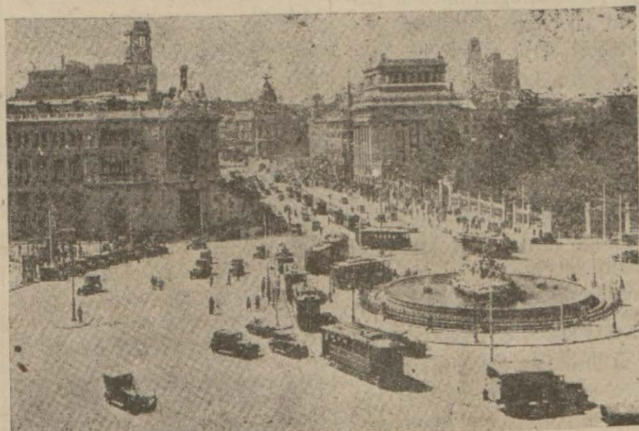
Madrid'den bir görünüş.

General Franko kumandasındaki Faslı askerler Abdülkerim'in tahliyesini istiyorlarmış!