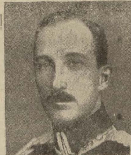
Bulgar kralı Boris

uğraşmak üzere toplanmış olan yüksek askeri divan vazifesini bitirmiştir. Harbiye bakanı olmak hasebile diyana da başkanlık eden haşbakan general Zlatof yüksek divan tarafından müttefikane alınan kararların kralın tasdikine iktiran ettikten sonra neşredileceğini bildirmiştir.