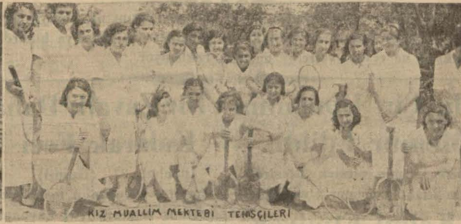
KIZ MUALLİM MEKTEBİ TEENSİLERİ