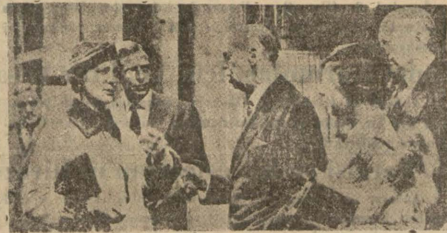
Yunan Prensi Nikola kızı ile beraber

— Malum olduğı vechile cümhuriyet rejimi 25 mart 1924 tarihindenberi Yunanistan'da hüküm sürmekte ve bu rejimî büsbütün siyasi firkalar