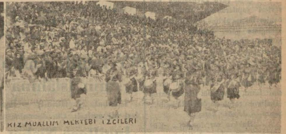
KIZ MUALLİM MEKTEBİ İZCİLERİ

Cuma günü Alsancak stadında yapılan Mektebliler jimnastik bayramına aid görüntüleri.