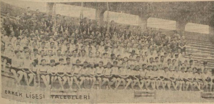
ERKEK LİSESİ TALEBELERİ