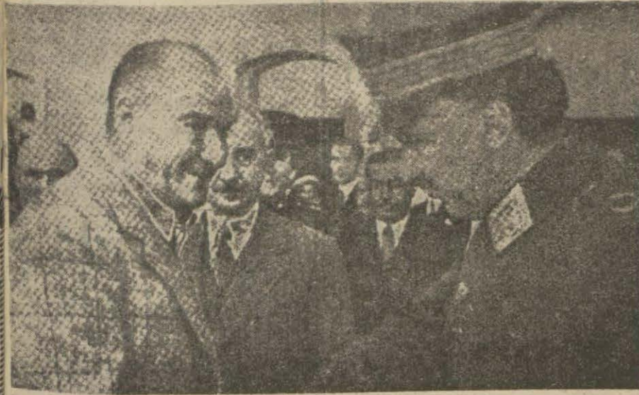
Atatürk ve Mareşal Fevzi

Yüksek Müdafaa Meclisinin Toplantısı. Bu Toplantıda Yurdun Yüksek Siyasa ve Korunması İşleri üzerinde Konuşuldu.