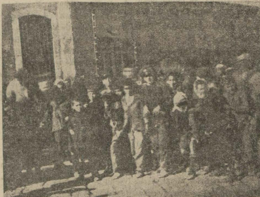
Hilâliahmer şubesi önünde bekleyen fakirler..

1 — Yeni yılın bütün köylü için kutlu olmasını, sağlık getirmesini, gençlik ve bollukla geçmesini, köylümüzün yeni bayındırlıklara kavuşmasını dilerim.