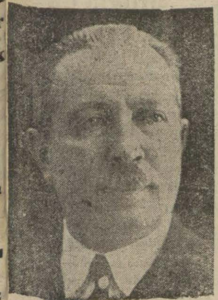
Vali General Kâzım Dirik

Türk köyü ve köylüsü Türk devletinin temeli ve kültürü — Sonu 6 ncı sahifede —