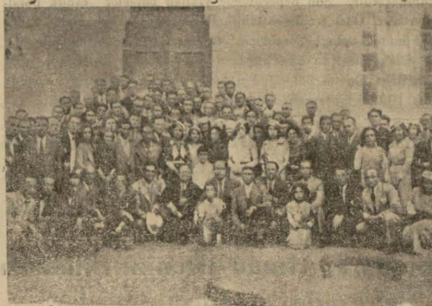
Değerli konuklarımız Manisa öğretmenleri Halkevinde

150 öğretmen Atatürk'ün Heykeline Çelenk Koydular ve Halkevinde Verilen Konferansı Dinlediler