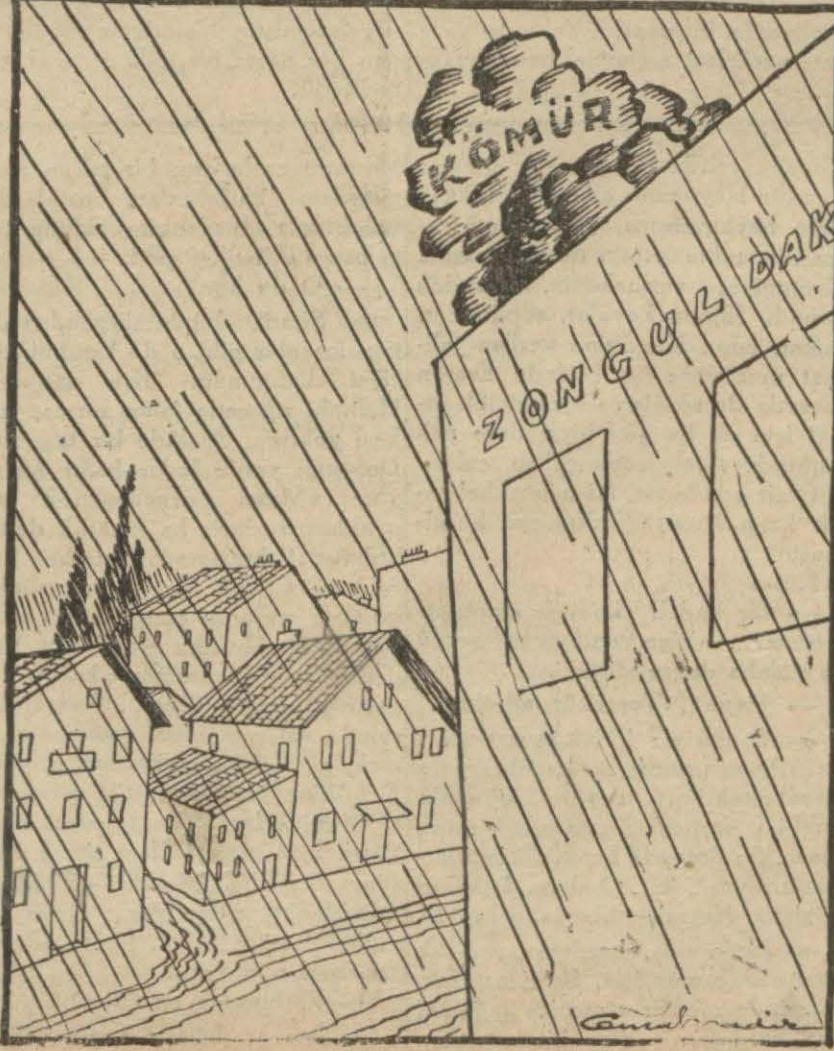
«Yağmur yağıyor, seller akiyor, Arap kıızı damdan bakıyor!..»

Oda, zeytinyağının toptan 190 kuruşa kadar yükselmesini yersiz bulmuştur. Yüksek fiatle tanzim edilen faturaların sonradan dolma olduğu ve fiat tereffüünde aynı zamanda müstahsil rolünü yapan tüccarın sebep ve âmîl olduğu tesbit edilmiştir. Yağ fiyatlarının düşürülmesine buradan tesir edilemeyeceği, fiyatları düşürmek için istihsal mntakasında tedbir alınması lâzım geleceği de ayrıca bildirilmiştir. Vekâletin istihsal mntakasında alacağı tedbirden sonra fiyatların mühim miktarda düşeceği yazılmıştır.