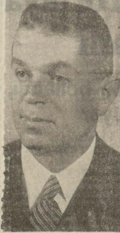
Ticaret Vekili Dr. Behçet Uz

O, her hangi bir kararın tabikinde güçlük olduğuna dair gelen raporların ve uzun uzun şikâyetlerin doğru olup olmadığını bizzat mahal-