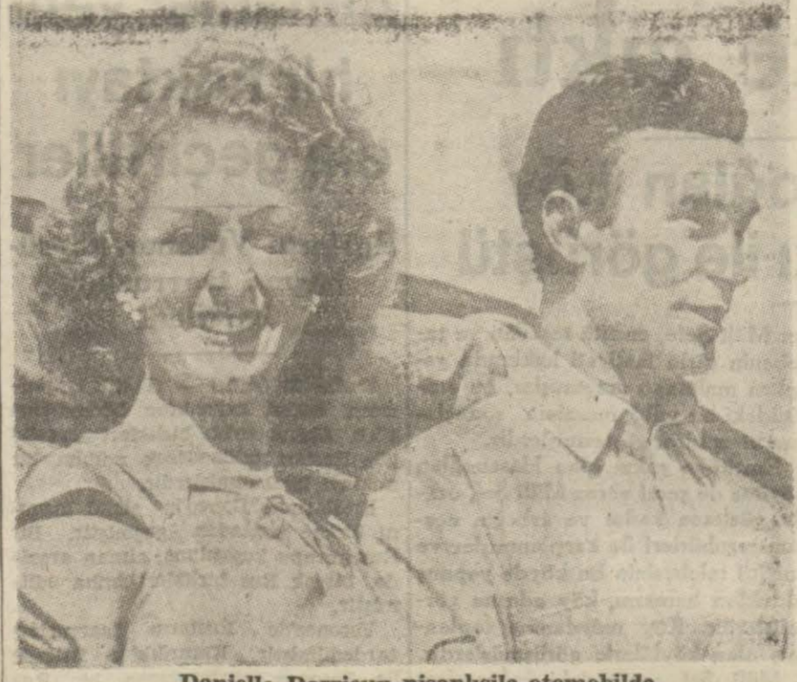
Danielle Darrieux nişanlısıyla otomobile

Artistin bu defaki kocası cenubi Amerikalı bir diplomattır