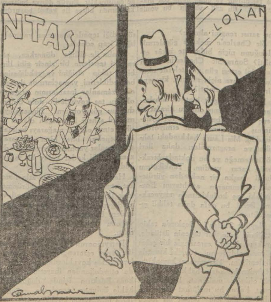
— Hey gidi hey!, Yasaktan evvel lokanta vitrinlerinde yemek tencereleri seyredildi...

Ankara 27 (Telefonla) — Sıhhiye Vekâleti, Çanakkale ve Muğla mıntakalarında da sıtma mücadelesine başlamağa karar vermiştir. Bergama, Boğazlıyan ve Tokadın Pazar mahiyesi ile Trakyada Demirköy ve İskenderunda birer sıtma mücadelesi başlatılacaktır. Antakya'da 20 yataklı, Birecik'te 15 yataklı birer trahom hastanesi ile Elbistan, Kozan, İslahiye, İskenderun ve Erzincan'da da birer trahom dispenseri açılacaktır. Adana ve Antep'te birer dispensar daha kurulması kararlaştırılmıştır. Urfa, Adıyaman, Antep, Malatya, Kilis ve daha bazı yerlerde olmak üzere 13 köy tedavi merkezi açılacaktır.