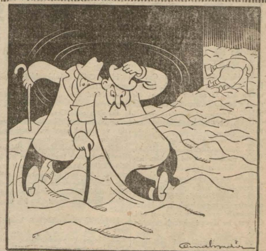
Bütün kabahat belediyede!... Kaldırımları temizlemedi diye mi?...

Vichy 4 (A.A.) — O. F. I.: Alman son haberlere göre Japonlar, Filipin adalarının en cenubunda ve Mindanao ile Borneo adası arasında bulunan Sulu adalarına asker çıkarmışlardır.