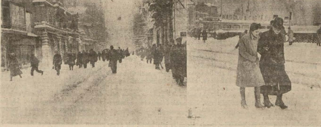
Istanbuldan iki karlı manzara: Biri Beyoğlunda, öteki Köprü üstünde

Ankarada kar bir metreyi aştı, civar kazalarda donarak ölenler olduğu haber veriliyor