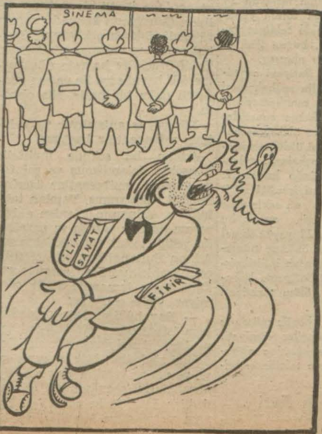
Bu ne perhiz

Konya 15 — Ticaret Vekili Dr. B. Behçet Uz, buranın tüccar ve es-nafile görüştüğünden ve tetkiklerde bulunduktan sonra Afyona hareket etmiştir.