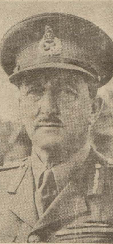
Yeni Genelkurmay Başkanı Gl. Brooke

Genel kurmay başkanı ve ikinci başkanı da değişti