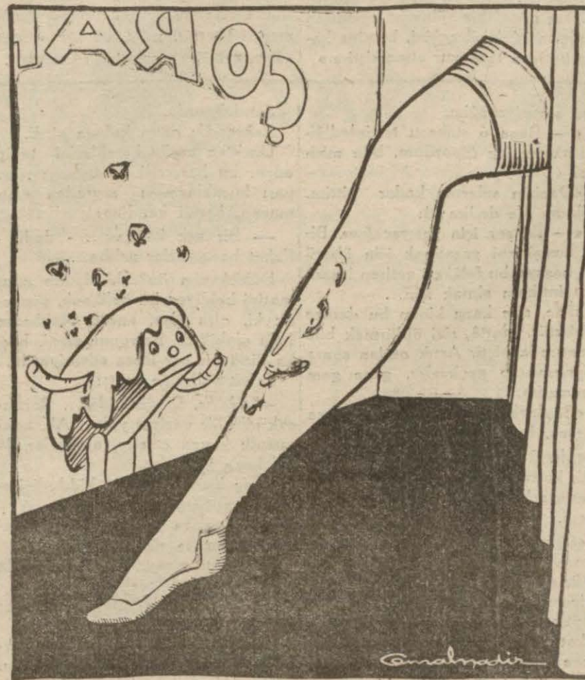
Pasta — Seni neden yasak etmediler arkadaş, sen lüks değil misin?.. İpek çorap — Belli değil dostum, erkeklere sorarsan lüksüm; kadınlarla sorarsan zaruri ihtiyaçlardan!..

Neuyork 8 (A.A.) — Colombia radyosu, Pasifikteki Wake adasının Japonlar tarafından işgal edildiğini haber vermektedir.