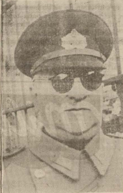
General Sabit Noyan

Örfî idare komutanlığına tayin olunan general Sabit Noyan dün saat 13 te Kadeş vapurile şehrimize gelmiştir. Bu sabahtan itibaren yeni vazifesine başlayacaktır.