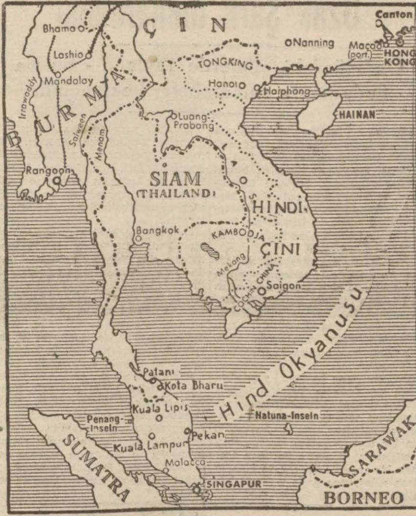
Japonların en ziyade faaliyette buldukları yerleri gösterir harita

şu koyacak, hem Amerikaya yardım edecektir. Nihayet, Japonyanın harbe girmesi Almanyanın Rusyadaki yükünü hafifletecek duruma yaratabilir. Bütün bunlar sulhu uzaklaştırmış, dünyayı tam bir çıkmaza sokmuştur. Dünyaya bulaşan harbin, şimdilik Türkiyeyi doğrudan doğruya ilgilendiren neticesi, iktisadî vaziyetin bir kat daha zorlaşması olacaktır. Deniz yollarının daralması ve güçleşmesi, ticaret münasebetlerinde sıkıntıyı arttıracaktır. Ona göre tedbirlerimizi şimdiden almamızdır. Necmeddin Sadak