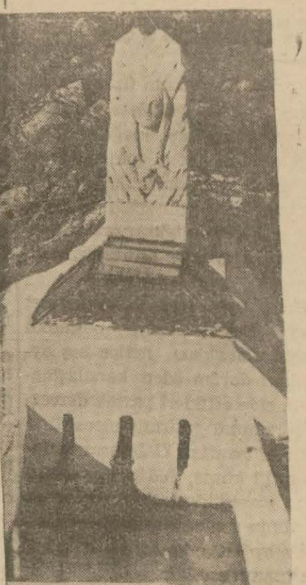
Urlacia Malgaca içmeleri kaynağı

Urla (Akşam) — Urla kazasına on kilometre uzakta bulunan hususi idareye aid Malgaca içmeleri, Türkiedeki meşhur içmeler arasında. Her yılın yaz mevsiminde yurdun muhtelif yerlerinden, bilhassa İzmire yakın bölgelerden binlerce kişi Urlanın Malgaca içmelerine gelir, onun şifalı kaynağından fıskıran suların içer, enerji dolu olarak yerlerine dönerler. Malgaca içmelerinin şöretinin bir sebebi de, Çeşme ilçesinin yolu üzerinde olmasıdır. Karaciğer ve böbrek taş ve kumlarından, barsak rahatsızlığından müteessir olanlar, mideleri zayıf olup da yediklerini kolay hazmedemeyenler, Urlanın Malgaca içmelerinde 3 - 4 gün kalarak tuzlu, fakat şifalı sudan içtikten sonra Çeşme ilçelerine gitmekte ve bu ilçelerden istifade etmektedirler. İçmede suyu her halde gün doğmadan içmek şarttır. O vakit hem serin, hem de hafif tuzlu olan kaynak suyu, güneş doğduktan sonra biraz sıcaklaşmakta, tuzu da artmış gibi bir vaziyet almaktadır.