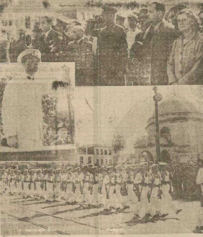
Dünkü Barbaros İhtifalinden birkaçstantane: Yukarıda solda nutuk söyleyen bahriye üstteğmeni, aşağıda: Kahraman bahriyelilerimiz Barbarosun türbesi önünden geçerken

Preveze büyük deniz zaferinin 403 üncü yıldönümü münasebetiyle büyük Türk amirali Barbaros'un hatırasını taziz için bir ihtifal yapılmıştır.