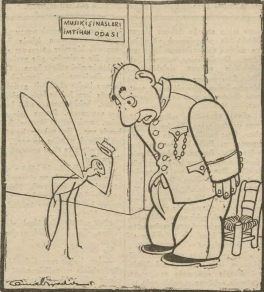
Odacı — Ve aleykümüsselâam!.. Sen de mi... Sivrisinek — Ne sandın ya?.. Koca yaz İstanbul'da icrayı ahenk eyledim!..

Vonheim'in cenubundaki mühim sırtlara yerleştirilmiş olan Sovyet top- ları düşmanı yan ateşine almaktadır. Yalnız topçu ateşinden Alman ve Ru- men zayıfların 50 bin kişiyi yüksel- diği tahmin edilmektedir.