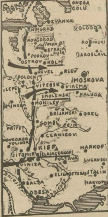
Son muharebelere sahne olan yerleri ve Almanların taarruz istikametlerini gösterir harita