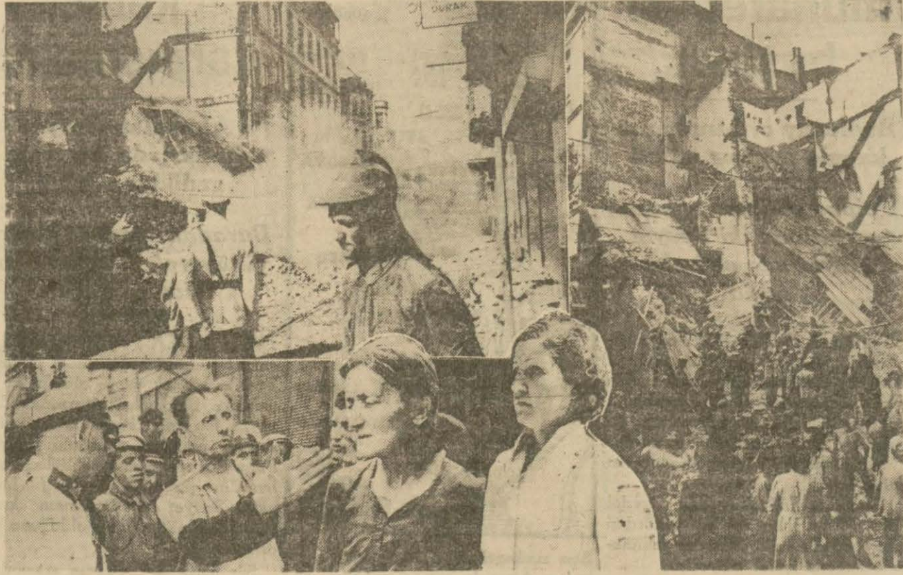
Dün yıkılan binalar ve kazadan kurtulanlardan bir kaçı

Dün saat 14,20 de Galatada Necatibey caddesinde Tophane ile Karaköy tramvay durağı arasında Kapuçi mevkiinde feci bir inhidam vak'ası olmuştur: Dördür katlı ve yarı kârgir iki bina birbirini müteakip yıkılmıştır. İnhidam caddede üzerinde vukubulduğundan tramvay, araba ve otomobiller işleyememişler. Bebek ve Ortaköy tramvayları Tophaneye kadar işlemişlerdir. Yol sabaha kadar kapalı kalmış ve ancak bugün açılabilmiştir.