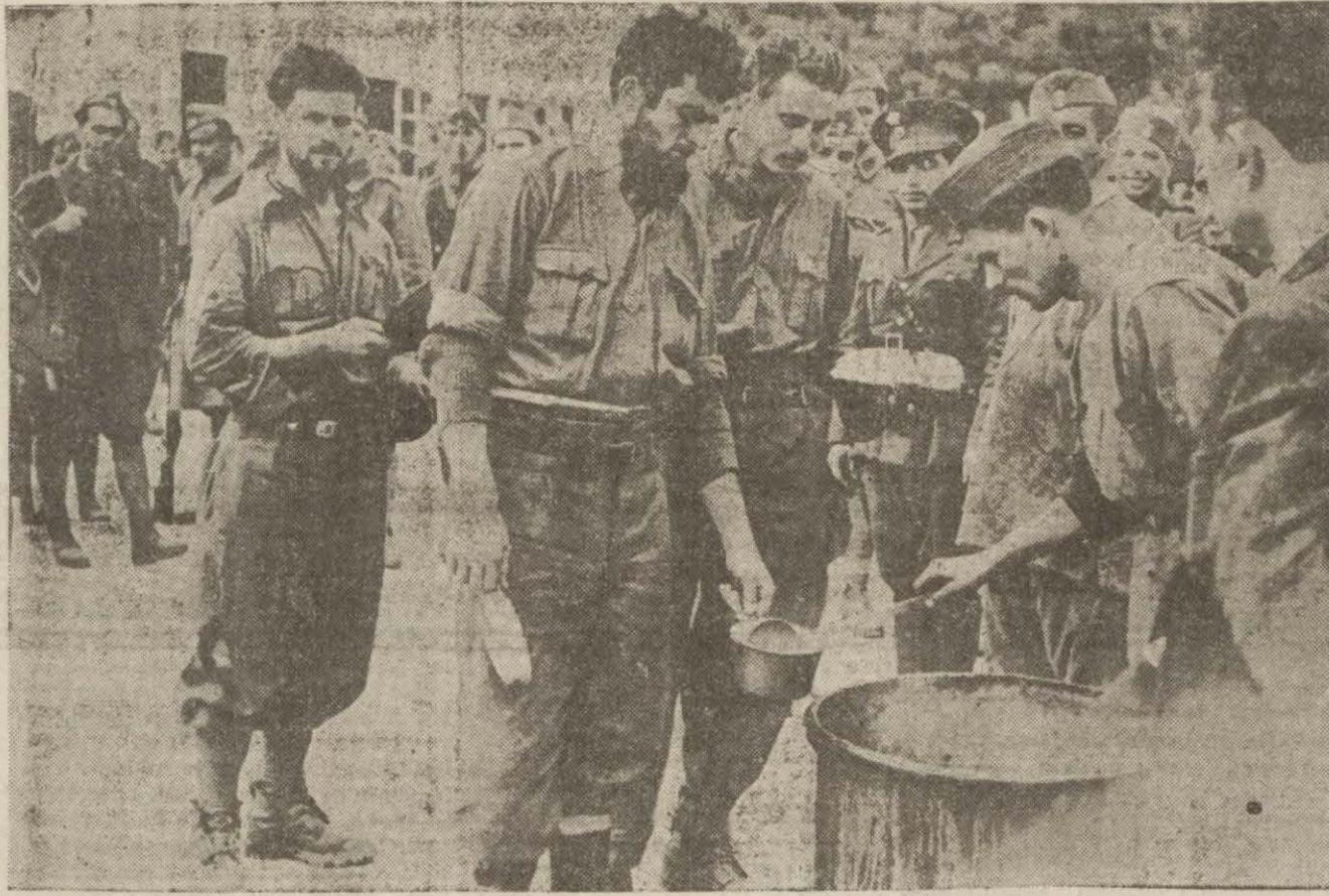
Atınaya geti rilen İtalyan esirlerine yemek tevzi edilirken

Bu asırdaki milletleri emperyalist harplere sürüklemek güçtür. Yunan ordusu önünde dövüşmek, ölmek istemiyen her İtalyan neferi, Yunanistanın çamurlu hududunda, sarp Arnavutluk dağlarında ne işi olduğunu bin nedametle her an kendi kendine sormuştur. Halbuki, mukaddes vatan toprağını haksız bir tecavüze karşı müdafaya mecbur kalan her Yunanlı, elbette aslan kesilir, kanını bu uğurda seve seve akıtır. Bu hakikati İtalyanların hatırlaması lâzımdır. Meşhur lâtin şairi Florace, «Od», larında, — iki bin sene evvelki — genç romahlara hitap ederken: «Dulce et decorum