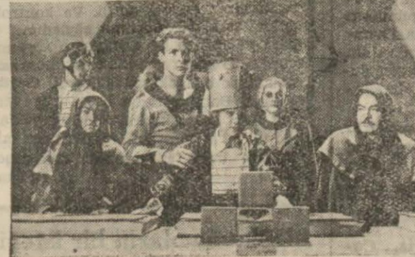
YARIN Matinelerden itibaren ALKAZAR sinemasında

- 5 - asır sonra ilim ve fennin en son terakkiyatı gösterecek ki, Arzdan Zuhal yıldızına seyahat, Zuhal yıldızındaki insanların, bambaşka medeniyetleri ve yaşayış tarzları.