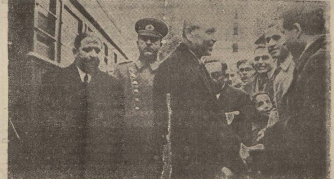
Adliye Vekili İzmirde Alsancak garında karşılayanlar arasında

Vekil, muhabirimize beyanatta bulunarak yeni teşkilât kanunu hakkında izahat verdi