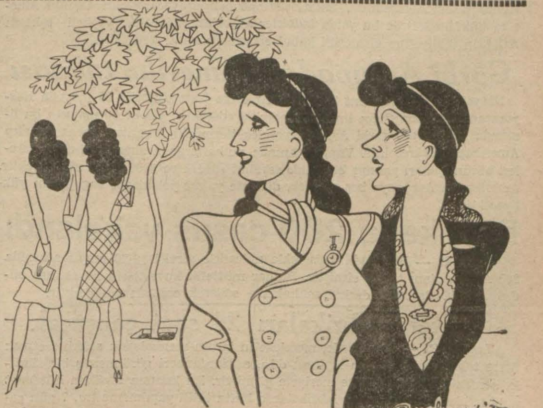
Son moda halka şapkalı kadınlar — Şunlara bak, sokakta şapkasız gzmekten utanıyorlar!

Cephelerdeki harekâta dair Fransız ve Alman tebliğleri 5 inci sahifemizedir.