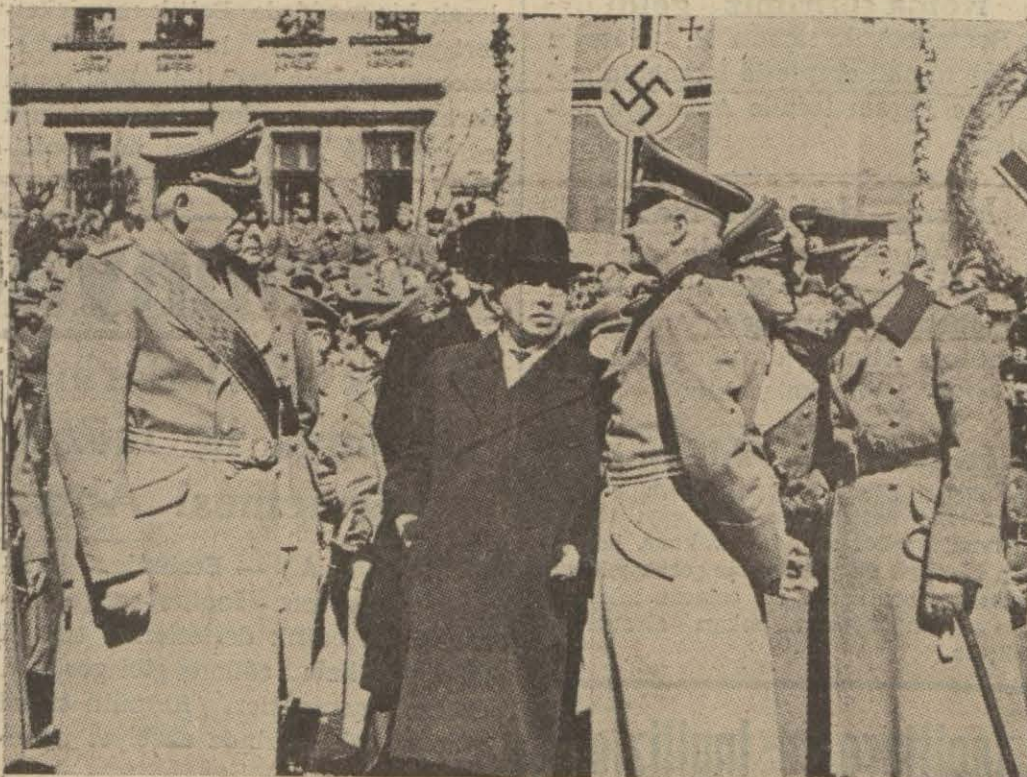
B. Neurath, eski Yugoslav cümhurreisi B. Hacha ve Alman generalleri Pragda

Hadise mıntakasında sinemalar, tiyatrolar, bütün mektepler kapatılıyor, akşam 8 den onsa kapılar, pencereler açık bulunmayacak