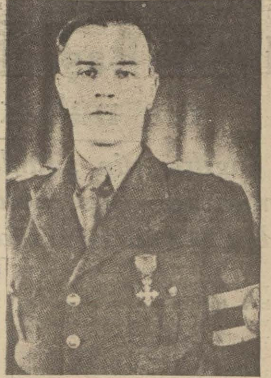
Rumen Hariciye Nazırı B. Gafenco