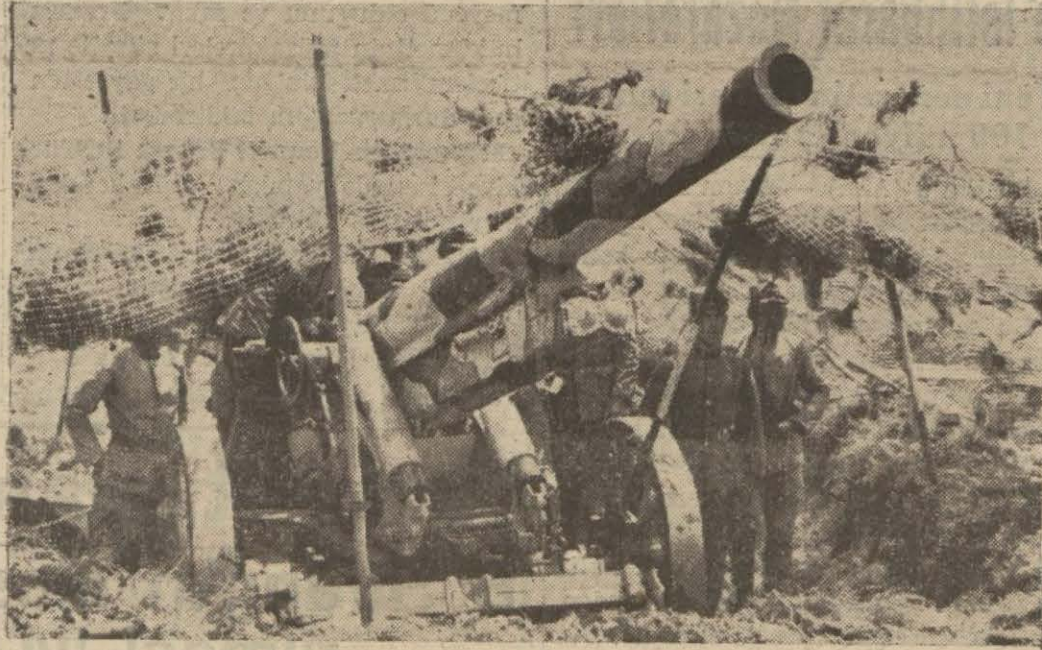
15 lik obüslerden biri mevzide

Kahraman ordumuza, her türlü asrı teşkilât ve malzeme ile teçhiz edilmiş bir topçu kuvvetile en mükemmel düşman ordusuna karşı koymağa muktedir güzide subaylar ye-