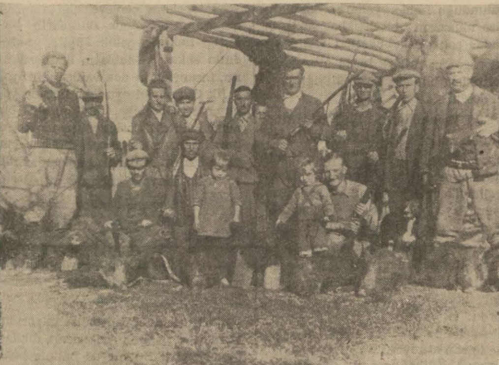
Paşabahçe ve Polonez köyünün meşhur domus avcılarının bir grup bir kaç gün evvel Alacalı ve Domalı meralarında süre avı yapmışlar ve 22 domus vurmuşlardır. Yukarıda avcılar ve yurulan domuzlardan bir kısmı görünüyor.