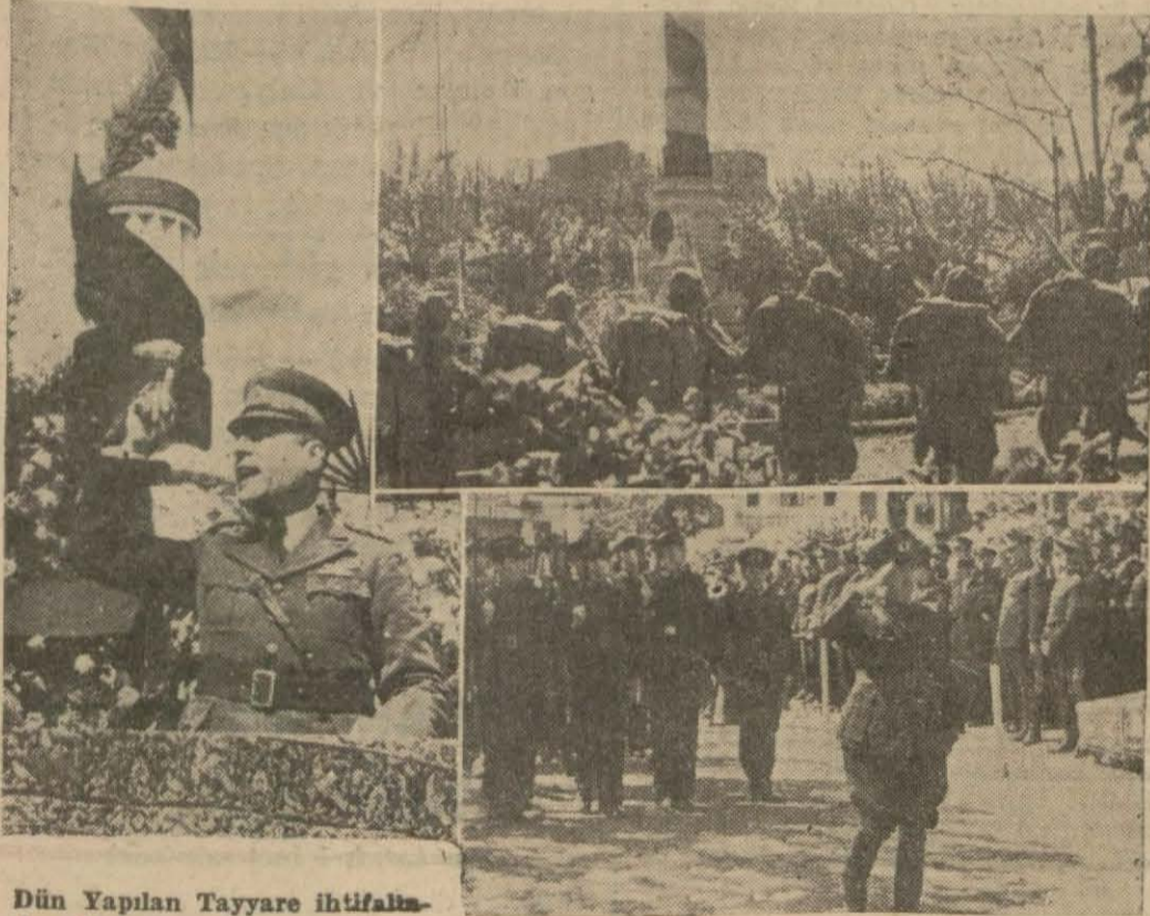
Dün Yapılan Tayyare ihtifalından üç intiba:

Fatih tayyare âbidesi önünde yapılan ihtifal çok hazin oldu, ateşli nutuklar söylendi