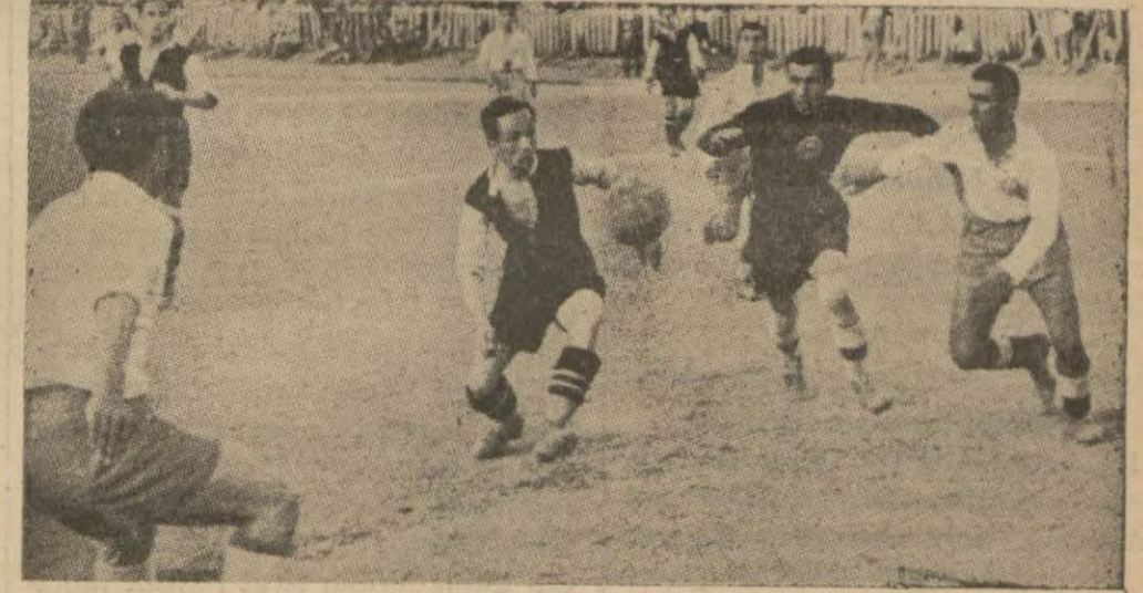
Münakaşalara sebep olan gol atılırken