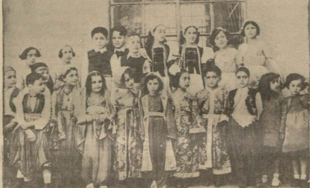
Yeni nesil ilkökulumun küçük talebeleri dün İstanbul Kız Hesinde bir müsamere vermişlerdir. Resmimiz çok eğlenceli geçen bu müsamereye iştirak eden küçükleri bir arada göstermektedir.

Bunun yanbaşında 700 ayak irtifaındaki üç tarafı bir iğne gökleri delecik gibi yükselmiştir. Yuvarlak, dünya ve yanındaki iğne, insanın inşa emelini temsil eden bir remizdir. Serginin bir ucunda Core Vaşing-