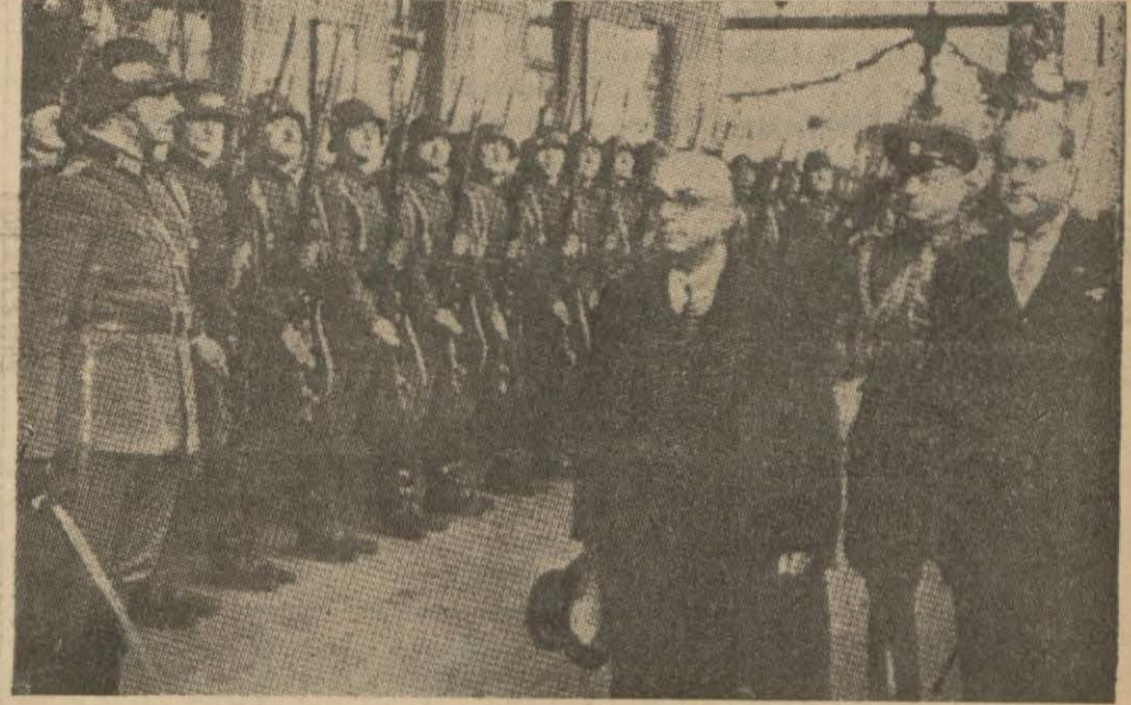
B. Celâl Bayarın Sofyayı ziyaretine aid bir intiba: Başvekilimiz B. Köseivanofla kendisini selâmlayan muhafız kıtaatını teftiş ederken

Başvekilimiz istasyonda Meclis Reisi, Vekiller, Mebuslar ve Elçiler tarafından karşılandı