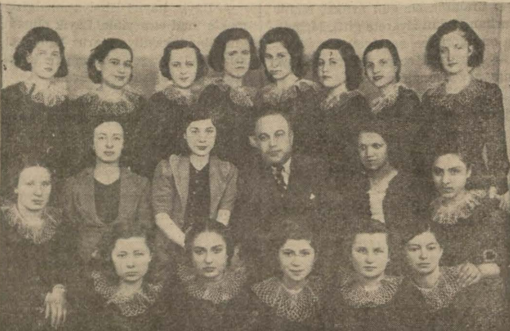
Tekirdağ (Akşam) — Tekirdağdaki ilk iğnek dikişi ve dikici yurdu her yıl olduğu gibi bu devrede de (15) bayana diploma vermiştir. Gönderdiğim resim bu hafta güzel bir sergi açan dikici yurdu, un mezun bayanlarını Kültür direktörüyle bir arada gösteriyor.