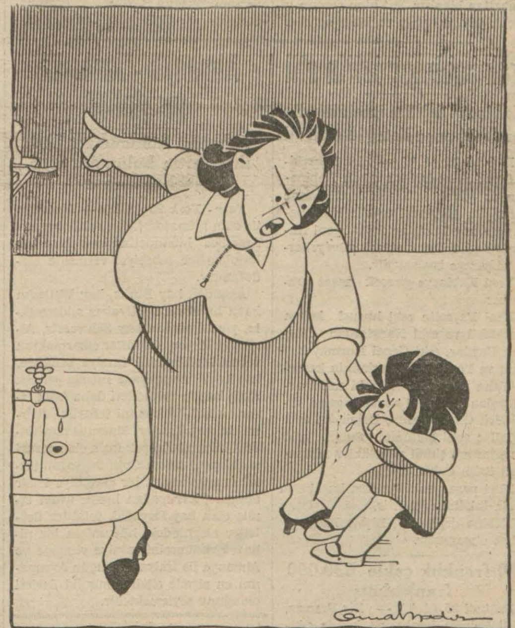
(Belediye reisi bilhassa temizliğe ehemmiyet veriyor) — Gazetelerden —