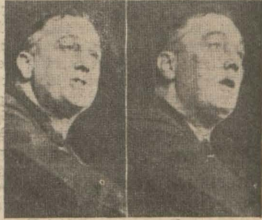
B. Rooseveltin nutuk söylerken iki vaziyeti