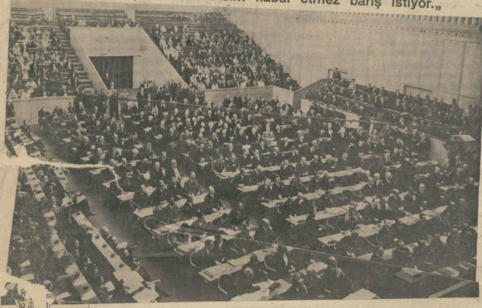
Milletler Cemiyeti asamblesi toplantı halinde

Fransız başvekili dün Milletler Cemiyeti asamblesinde söylediği nutukta böyle dedi ve Renin askerî işgalinden de bahsederek: "Fransa müttefik bir surette taksim kabul etmez barış istiyor.."