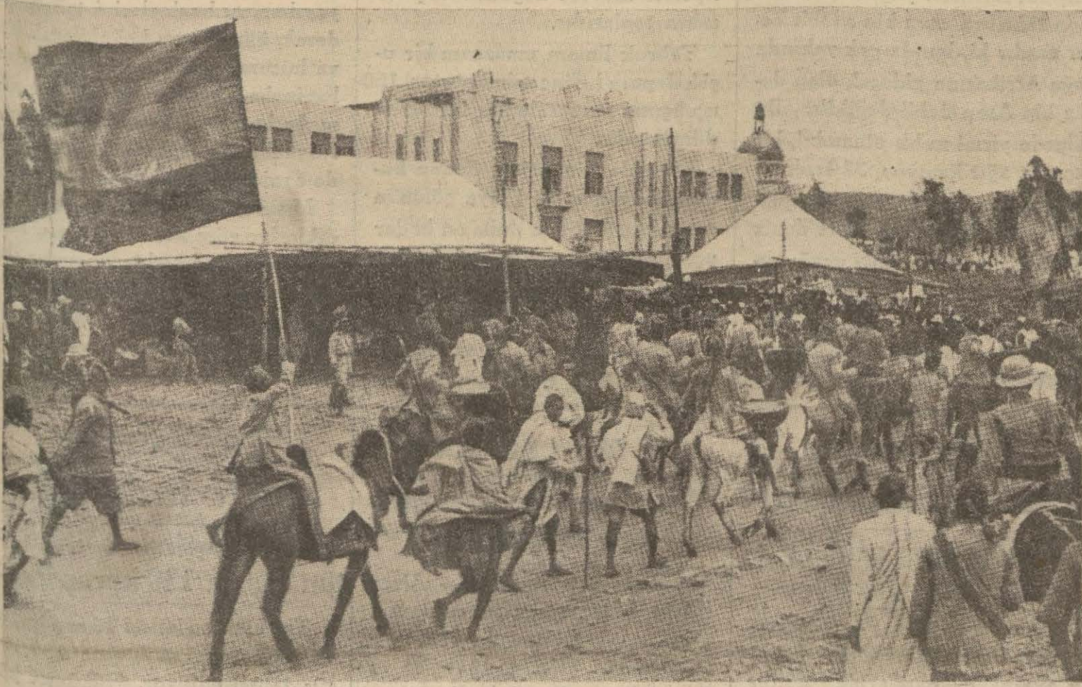
Bir Habeş muharip kafilesi Adis Ababa sokaklarından geçerken

Maksatları, hızlı bir yürüyüşle Habeş kuvvetlerini bir meydan muharebesine icbar etmektir, Makalleden epice ilerleyen İtalyan pişdarları mukavemete rastlamadılar