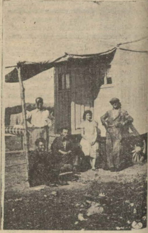
Ahır dağları üzerinde yol yapanların kampı

Mevziler de öyle. En ileri mevzilerle geri mevziler arasında yüzlerce metrelik mesafe var.