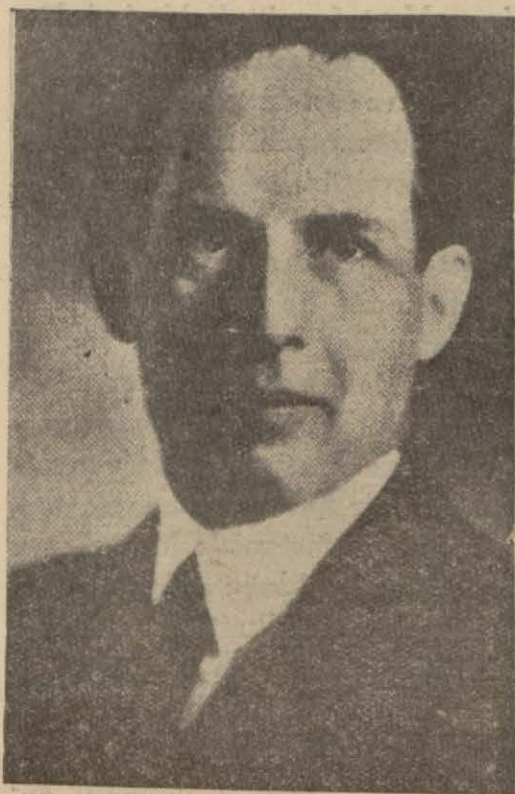
Yunan kralı Jorja

Cumhuriyetçiler bundan sonra kral Jorja, yalnız hilelisini değil, fakat hakiki reyîâmı bile memleketin idaresi için en fena bir sistem olarak telâkki ettiği