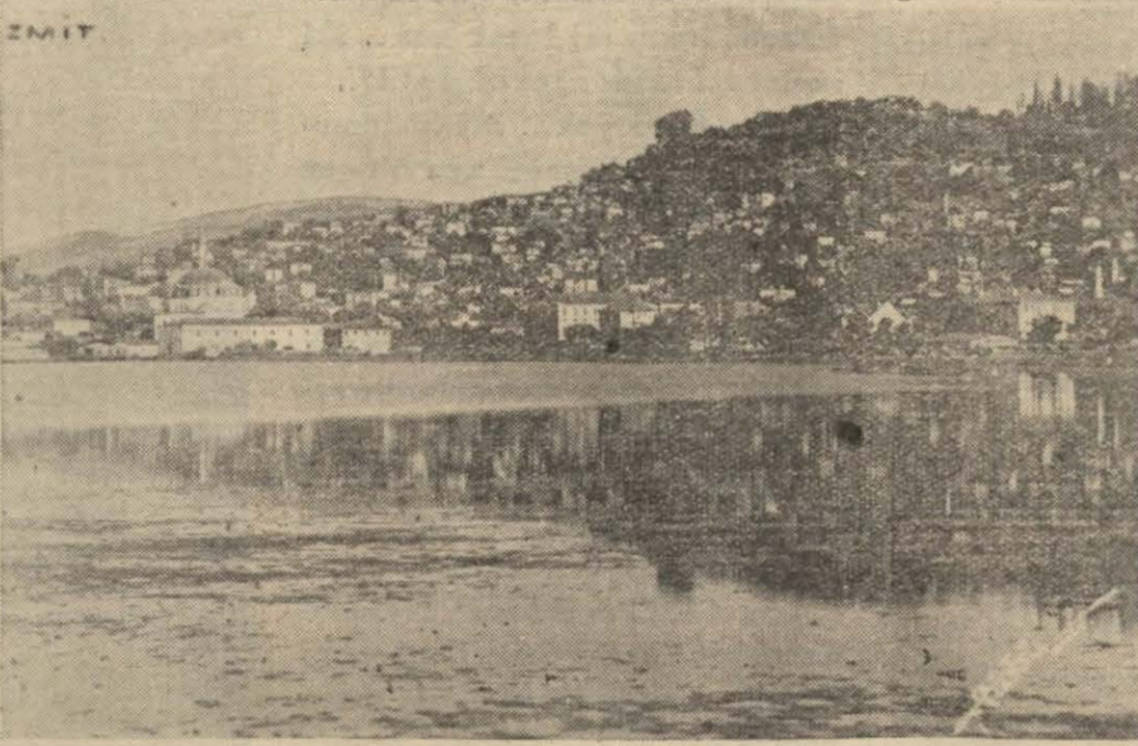
Izmitten bir görünüş

Izmit (Akşam) — Izmit şarbayının ve şar kurulumunun son yıllarda göze görünen başarıları arasında Izmit plânının da şehirci Yansene yaptırılması işi başta gelmektedir. Yansen, şarbay Kemal Özün plân hakkındaki mektuplarından birine verdiği uzun cevapta Izmitin yarın alaçağı durumu izah