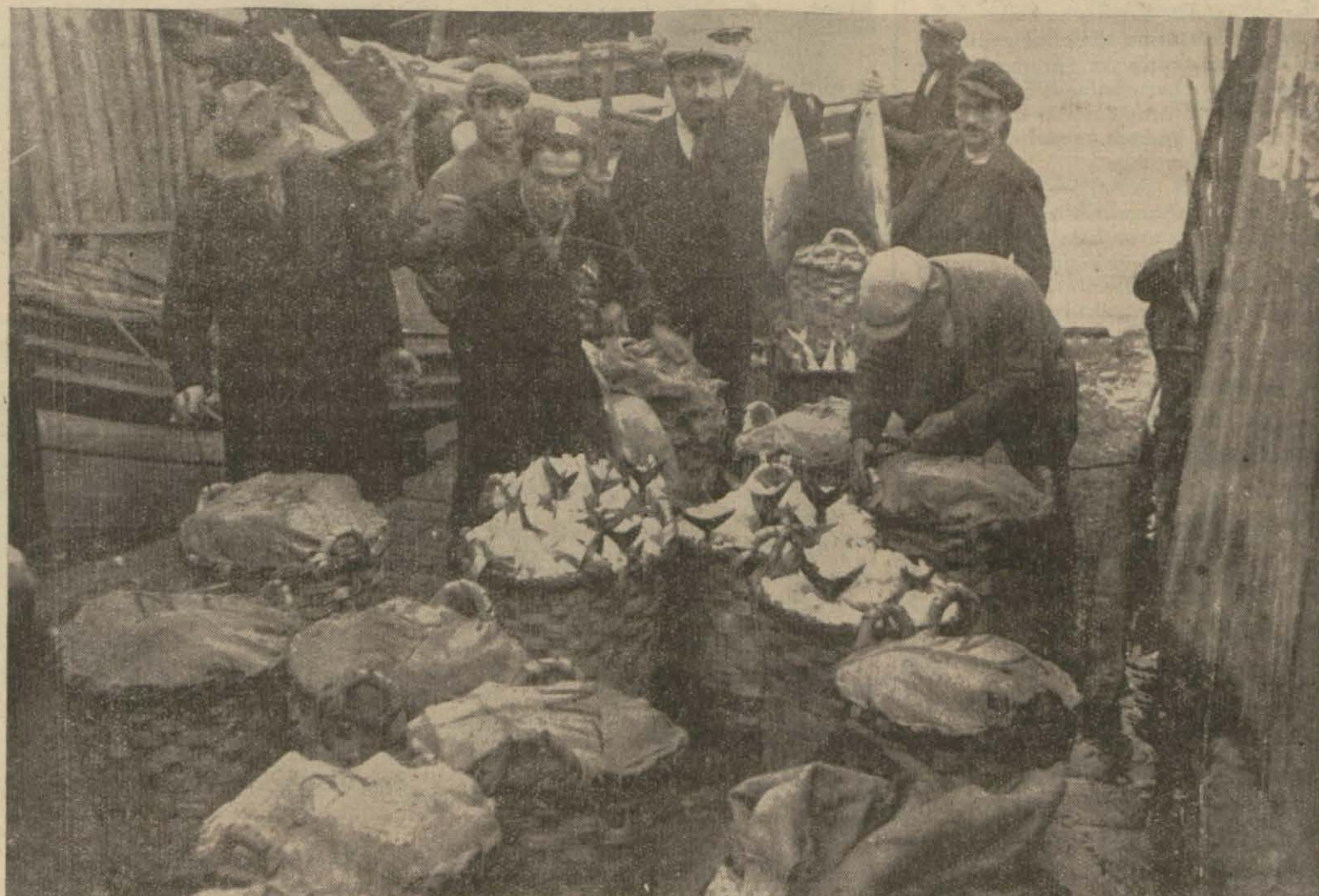
Istanbulda torik akımı devam ediyor. Bu torikler bilhassa limanımıza gelen küçük İtalyan vapurları ile Yunan yelkenlileri tarafından satın alınmaktadır. Yukarıki klişemiz, bir kayıktan küfe küfe çıkarılan torikleri gösteriyor.

O zamandanberi kendisine bay Ramazanın ailesi bakıyordu. Bahtiyar kaybolmadan evvel, bay Ramazanın evinde hizmetçi olarak kalan bir kadının kızı başka bir yere götürmeyi teklif ettiği söylendiğinden bu nokta göz önünde tutularak araştırmalar derinleştirilmektedir.