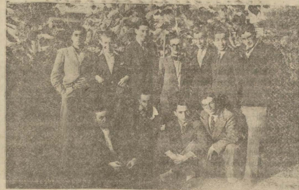
İki temsil veren Çankırı gençleri

Halkevinde bir temsil şubesi açılması kararlaştırıldı