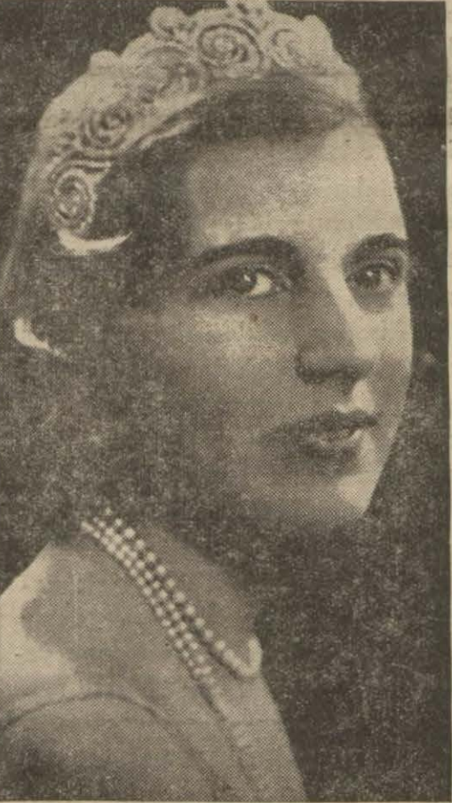
İsveç veliahtı Hz. ne refakat eden karımesi prenses Ingrid