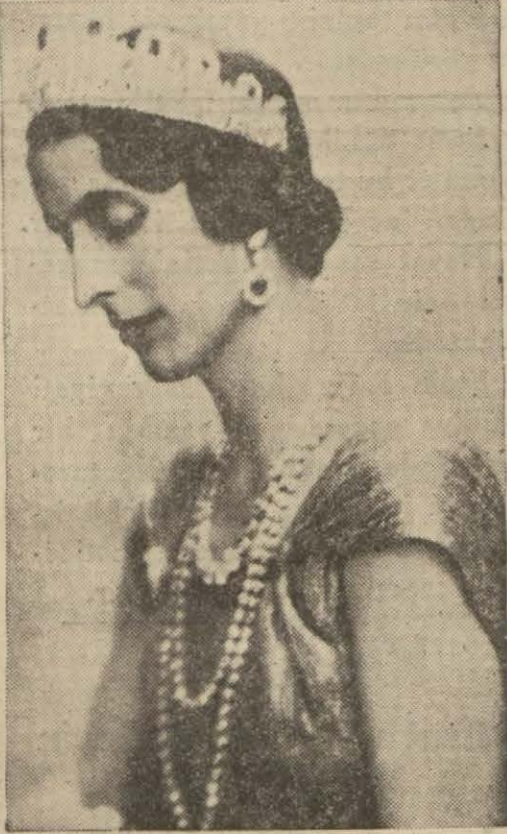
Veliahtın refikaları prenses Louise Hz.