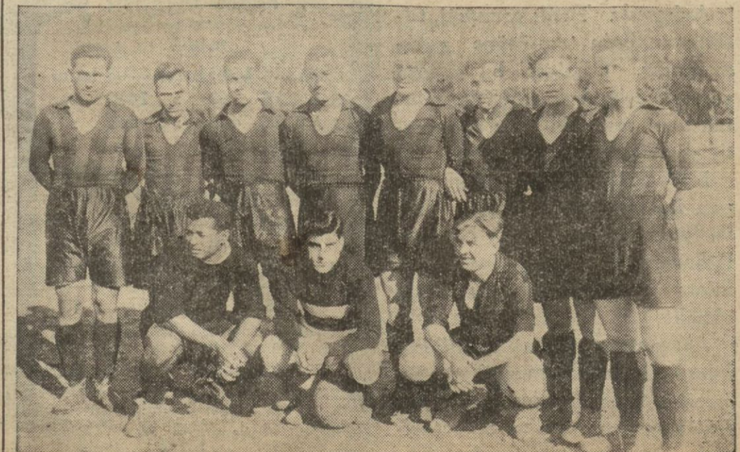
İzmirin Altay takımı