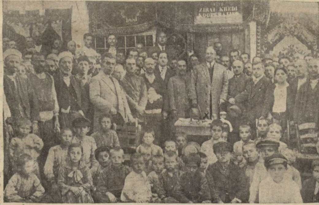
Zirai Kredi kooperatifinin açılış resmi (X İşaretli İzmir valisi Kâzım paşadır)

Nazilli mezbahasında kesilen keçilerde hastalık çıktığı bildirilmiştir. Nazillide tatbik edilen koyun çiçeği aşısının tesiri görülmemiştir. Vekâlet mütehas-sılarından Muzaffer bey, bu iş için Nazilliyeye gidecektir.