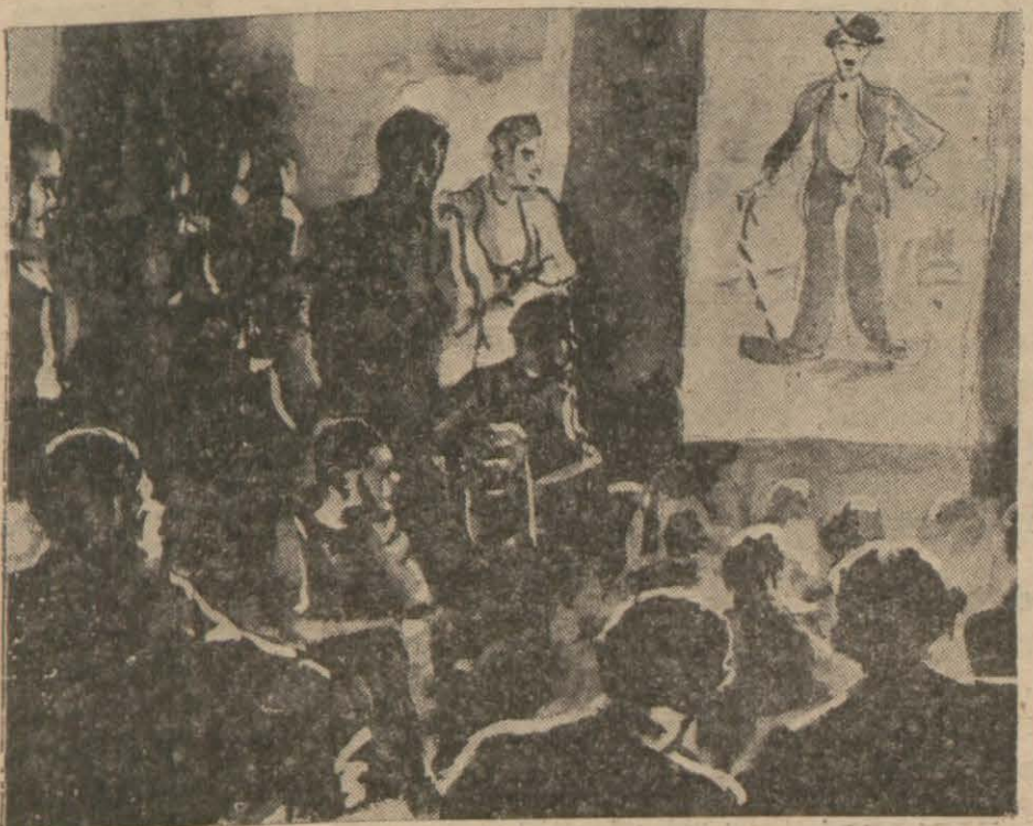
[Yazısı 6 ncı sayfada]

Makinesiz, perdesiz, plâksız, rad- yosuz sesli, sözlü, şarkılı sinema?