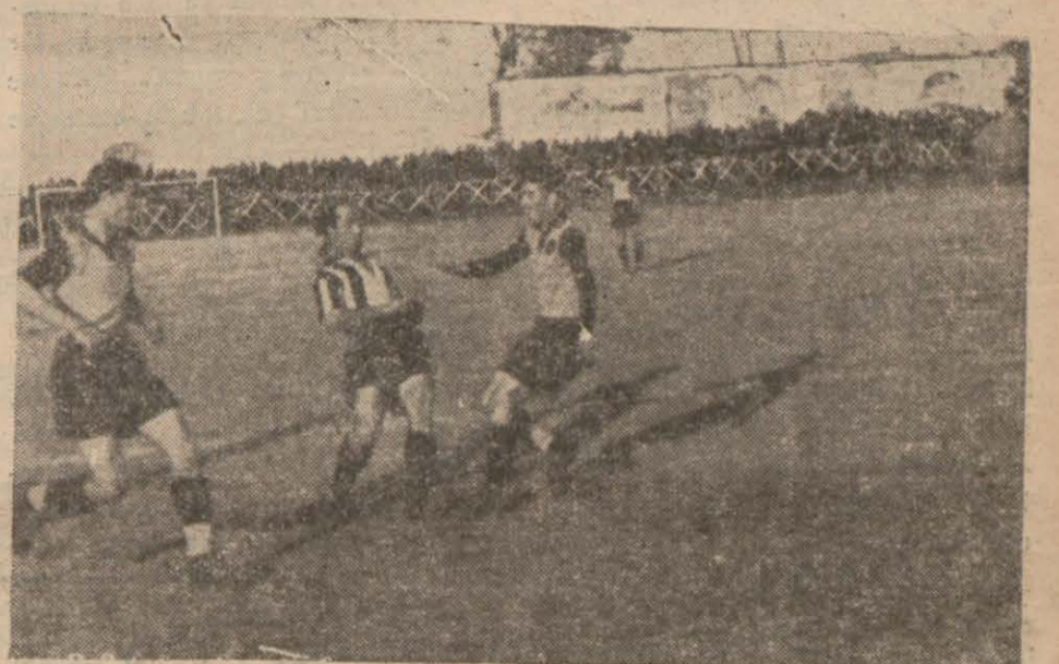
Beşiktaş - Ankaragücü maçından bir enstantane [Maçın tafsilâtı 5 inci sayfamızda spor kısmımızdadır.]