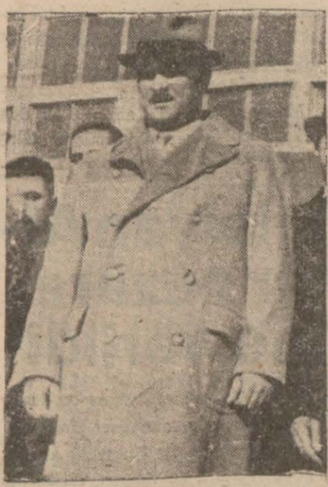
dost Başbakanları Sita yodivonç

Sofya 11 (Hususî Muhabirimizden Telefonla) — Başvekilimiz refikaları ve Hariciye vekilimiz Rüşti Arası hâmil olan ekspres Filibe istasyonuna bu sabah saat dokuz kırk geçe dahil olmuştur.