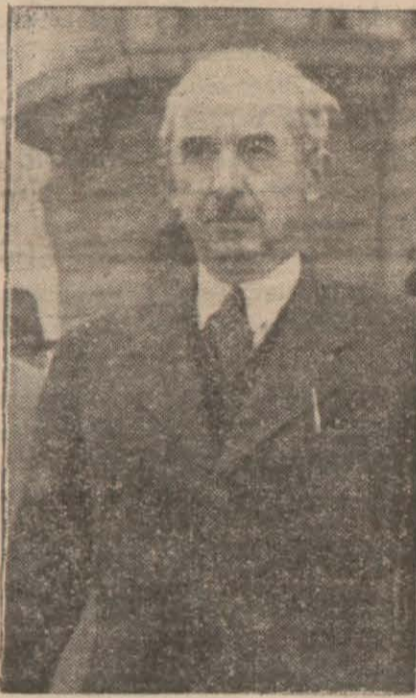
İki kardeş milletin İsmet İnönü